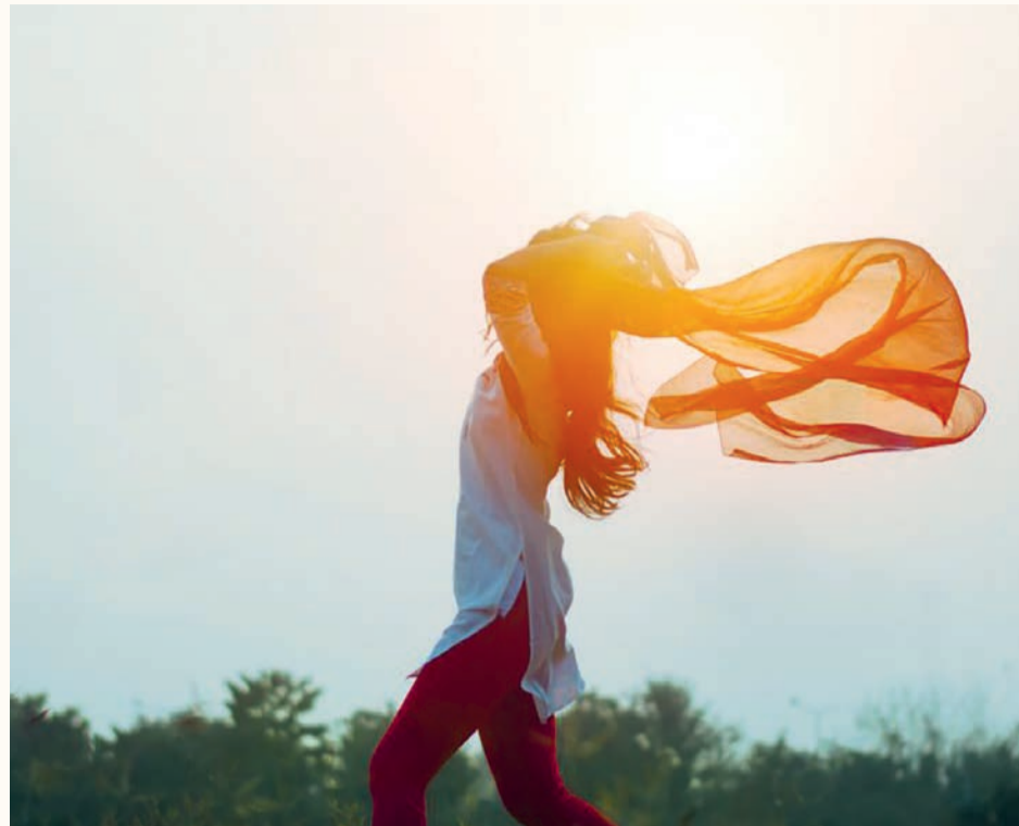
La médecine complémentaire est très appropriée pour activer les forces d'autoguérison.

En cas de coupure, par exemple, l'organisme réagit physiologiquement par la coagulation du sang. L'autoguérison est régie, orchestrée par un élément supérieur. Dans les disciplines de médecine complémentaire, on parle, en médecine anthroposophique, de l'organisation du moi, en médecine traditionnelle chinoise, de Qi et Tao et, en homéopathie classique, de force de vie.